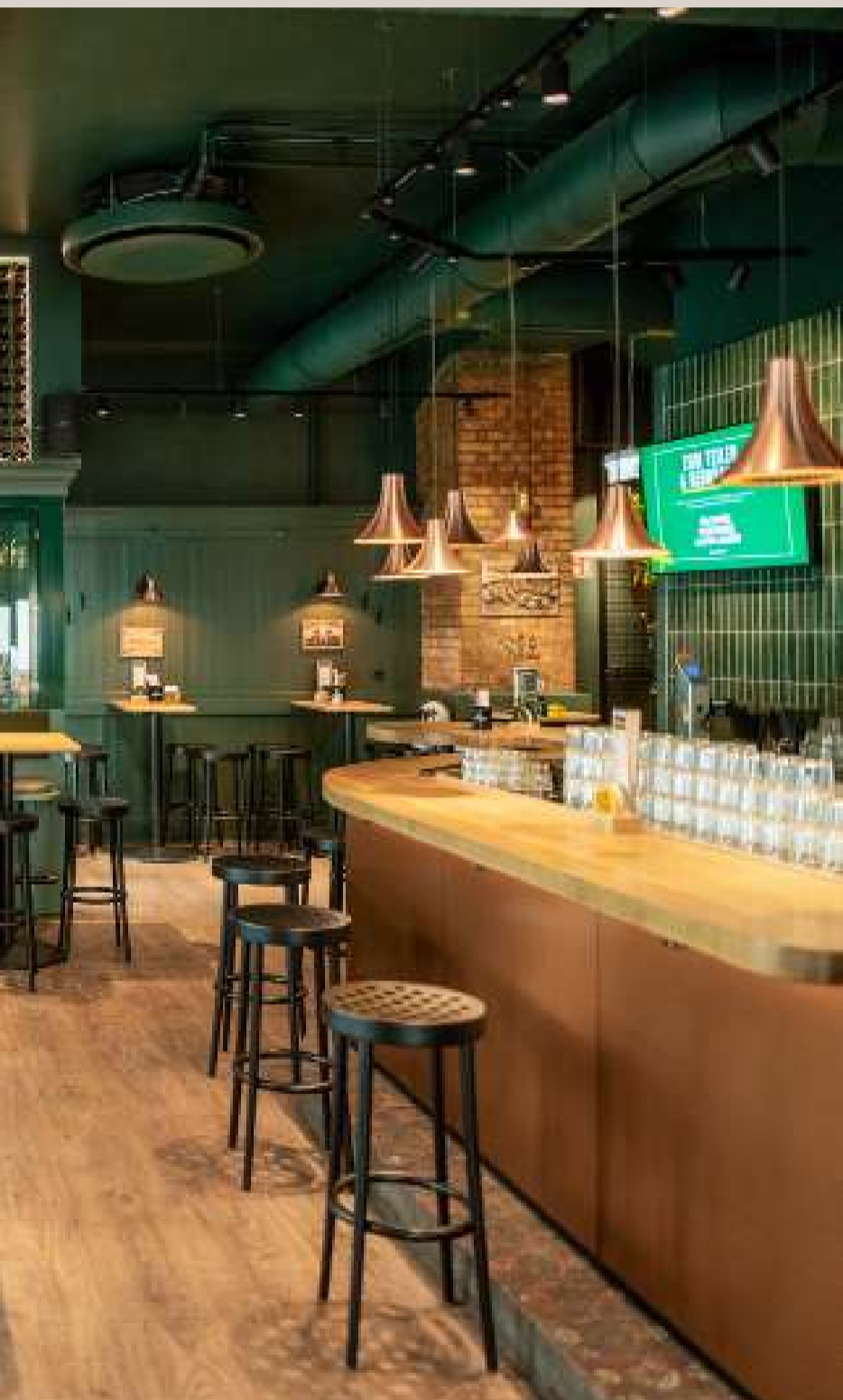
Bermudabrau, 1010 Wien