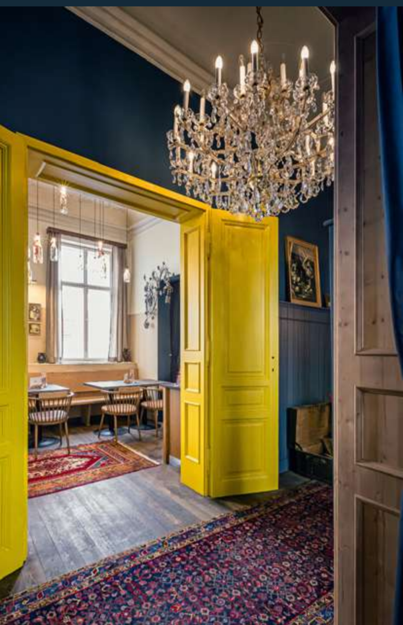
Napoleon, 1220 Wien