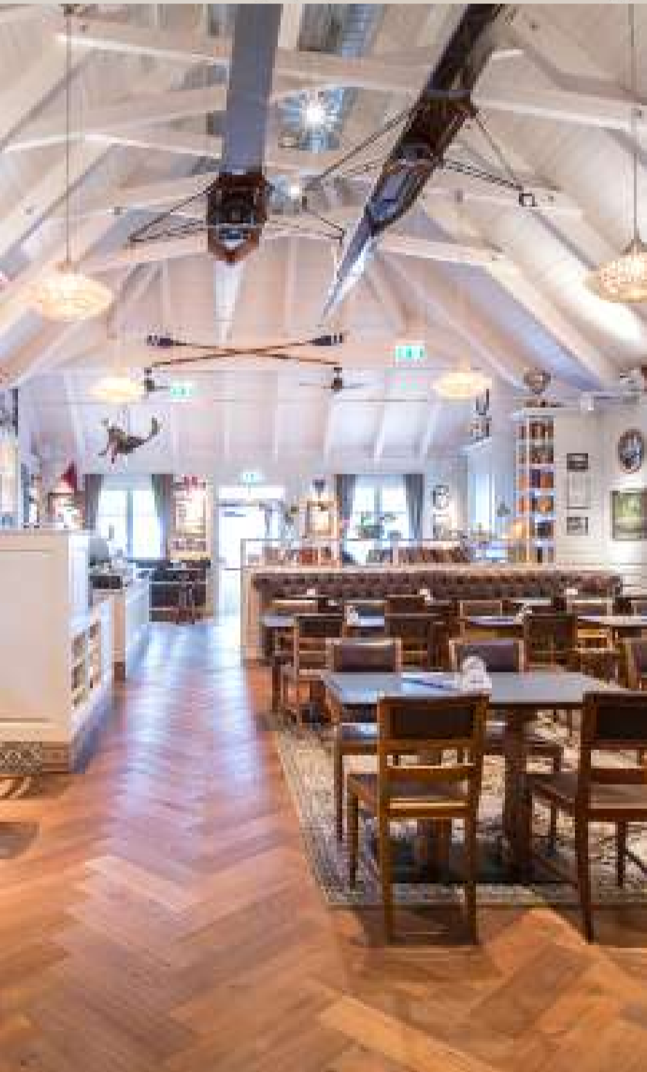
das Bootshaus, 1220 Wien