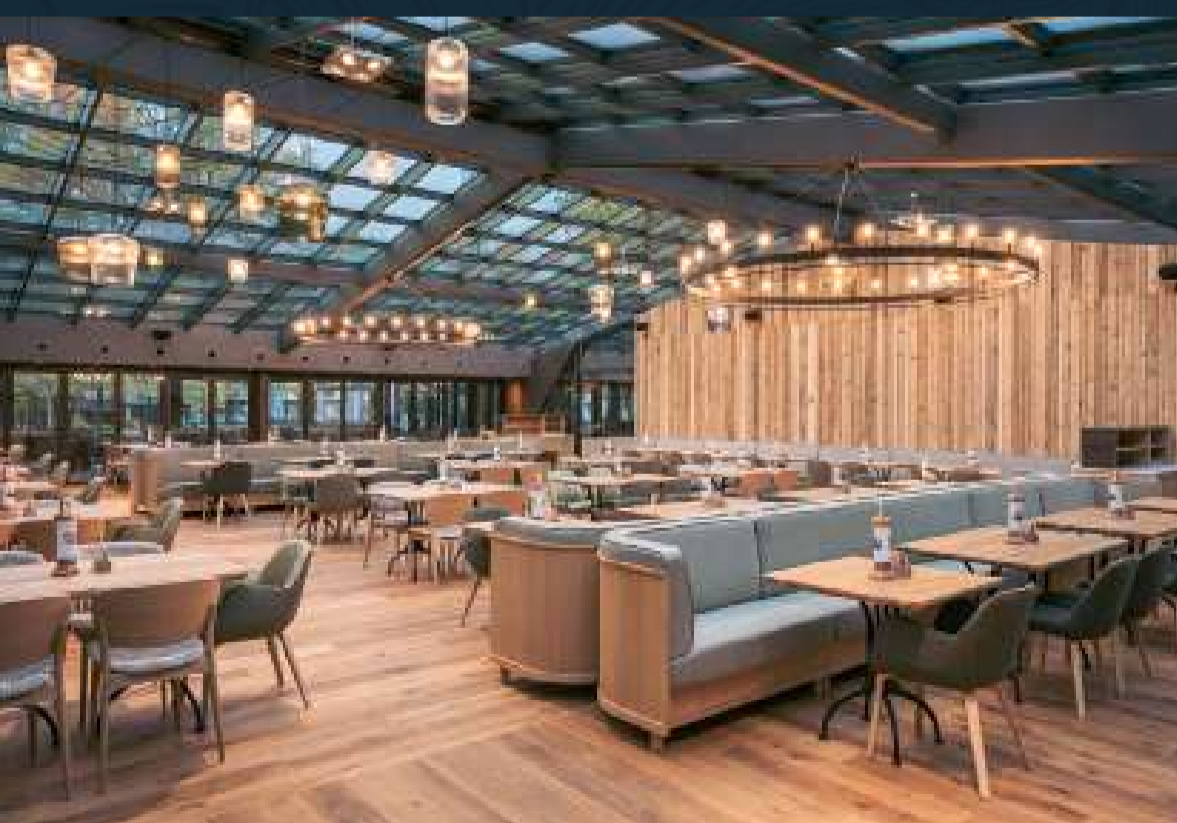
Kolarik im Prater, 1020 Wien