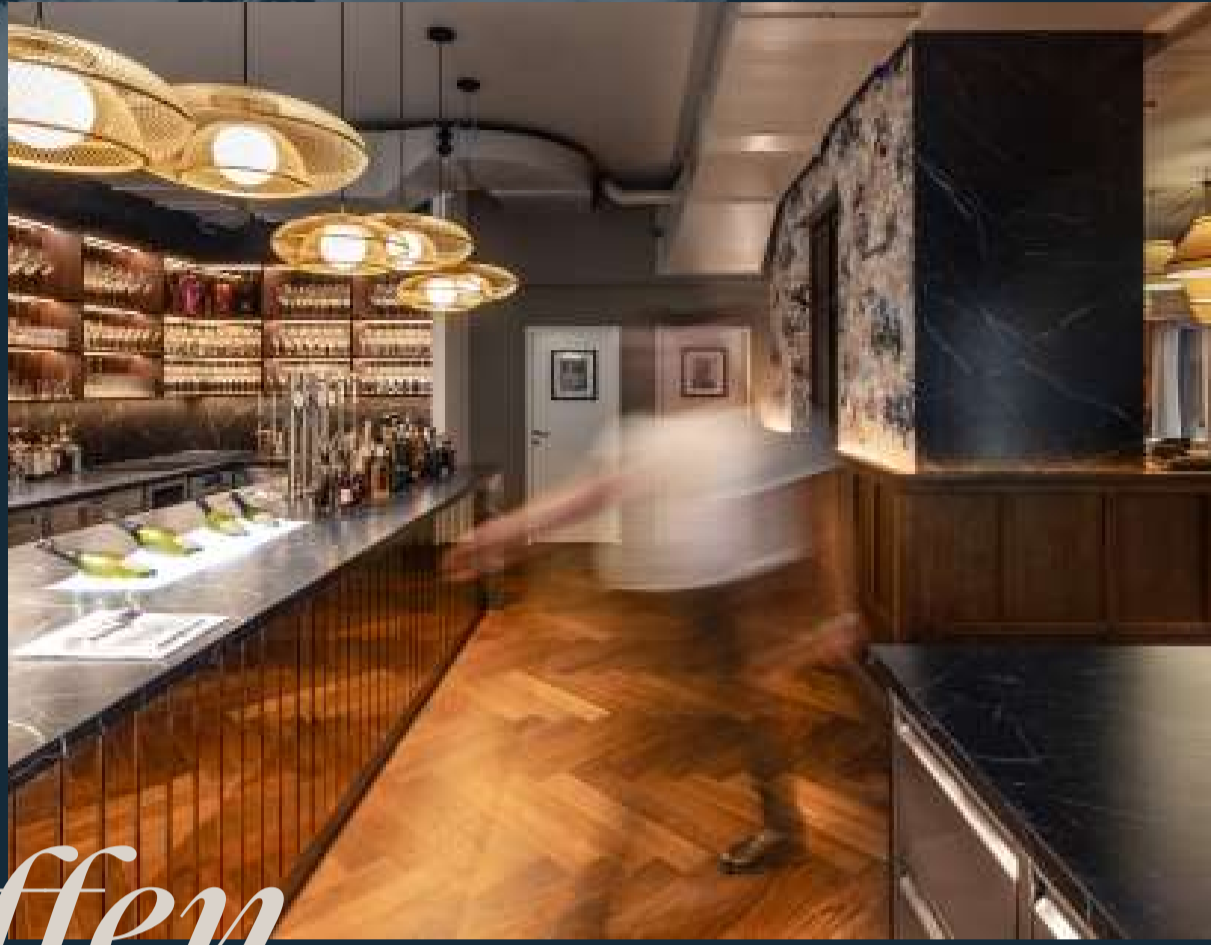
Boxwood, 1010 Wien