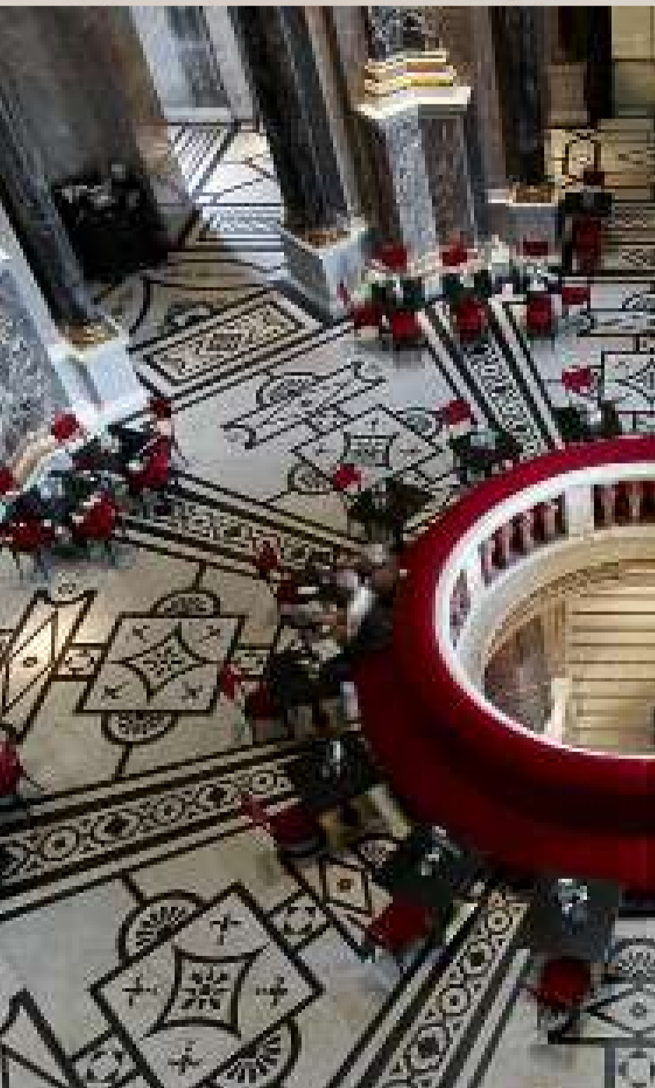
Kunsthistorisches Museum Cafe, 1010 Wien

NATÜRLICH IST JEDES LOKAL EIN AUSDRUCK SEINER GASTGEBER:INNEN.