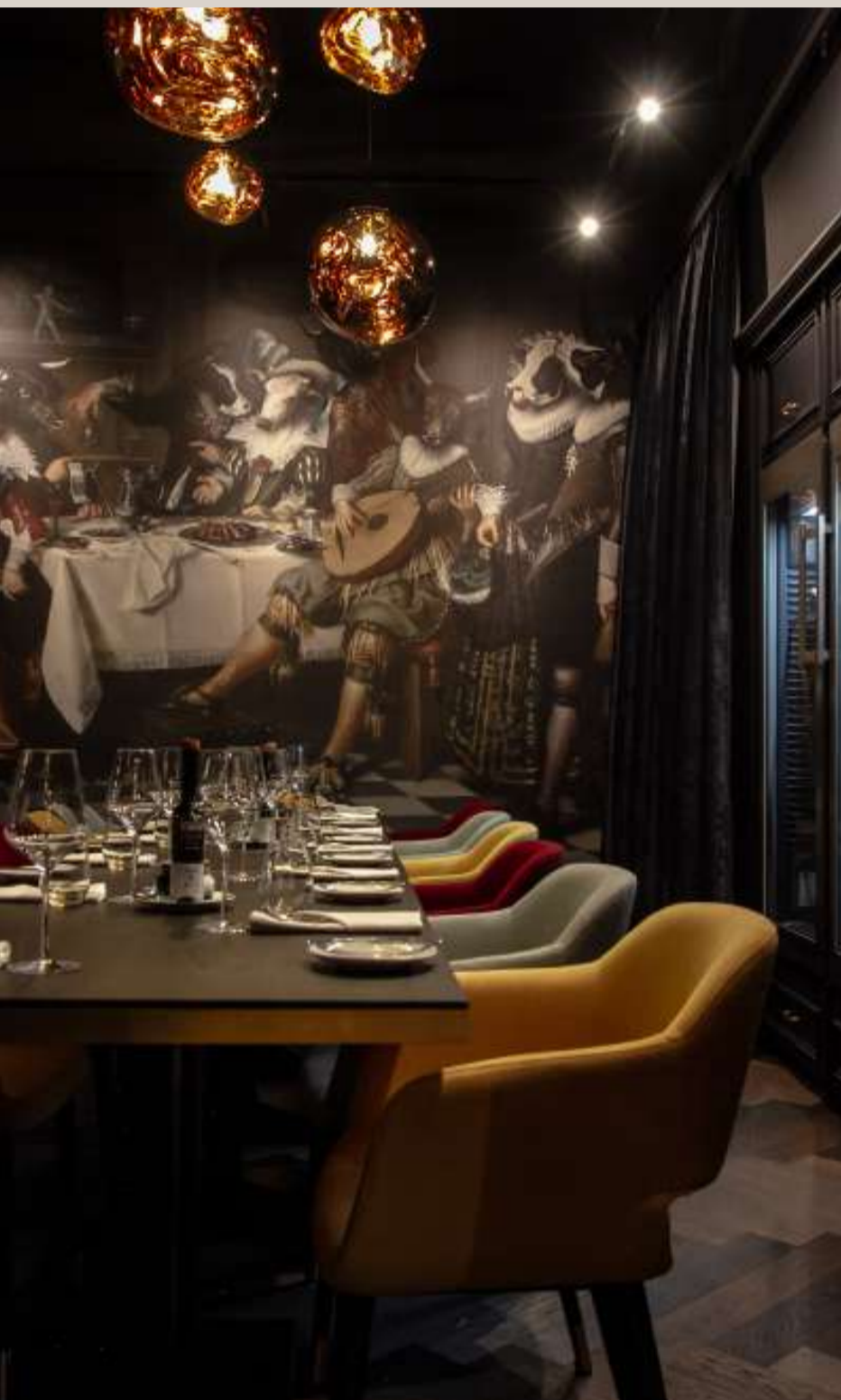
Beef & Glory, 1080 Wien

EIN STARKES KONZEPT ENTSTEHT DORT, WO EINE KLARE VISION AUF EIN PRÄZISES VERSTÄNDNIS DER ZIELGRUPPE TRIFFT.