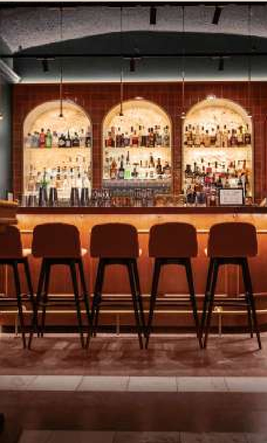
Cinco Bar, 1010 Wien

JE NÄHER DIE ERÖFFNUNG RÜCKT, DESTO DICHTER WIRD DER PROZESS.