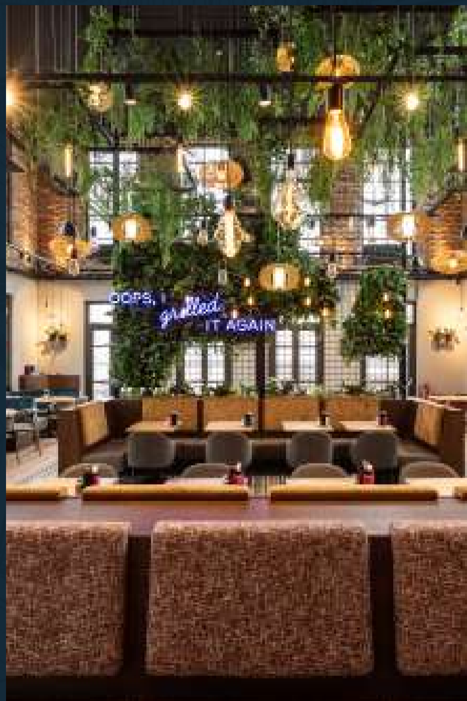
Le Burger, Krems