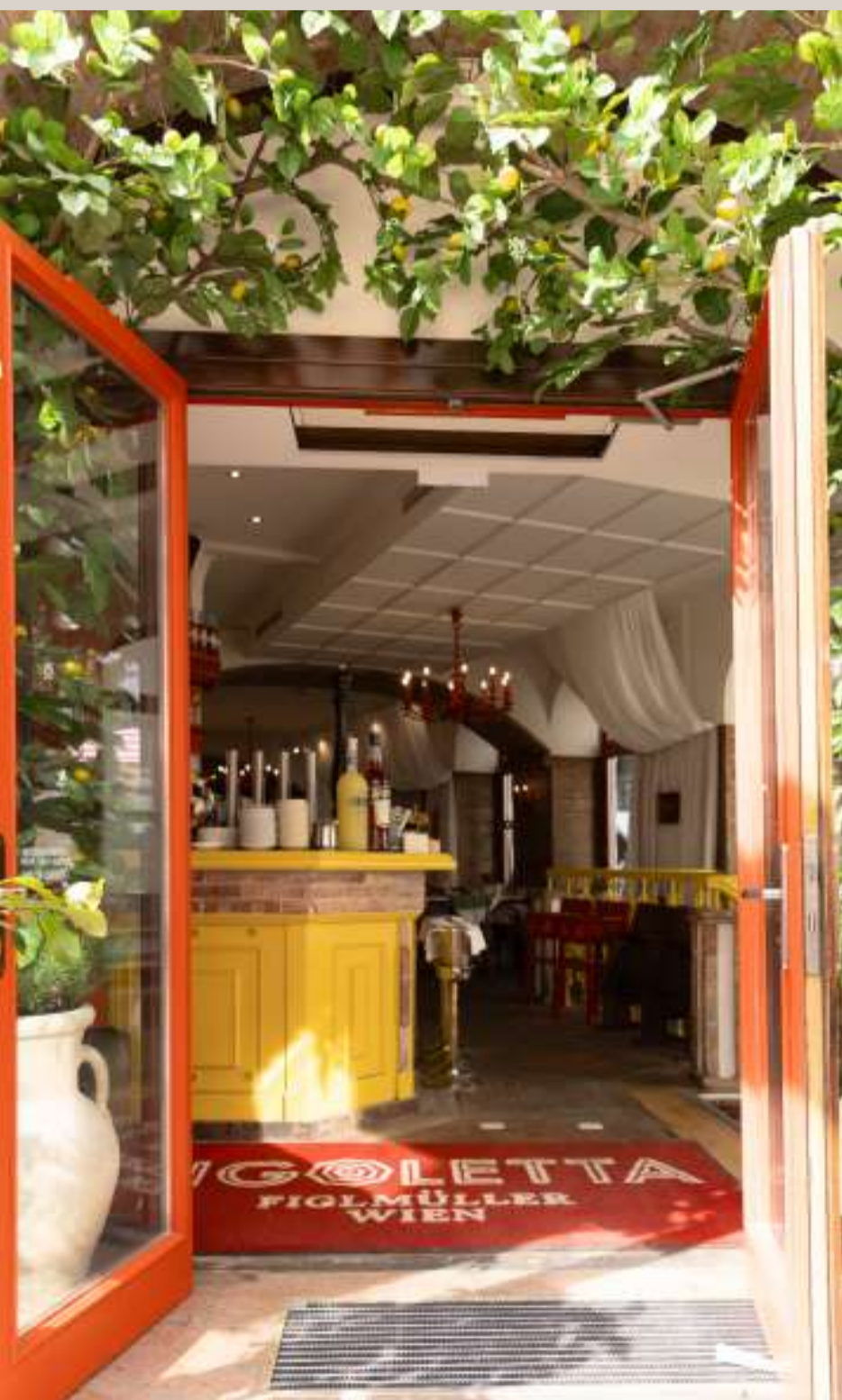
Figoletta, 1010 Wien