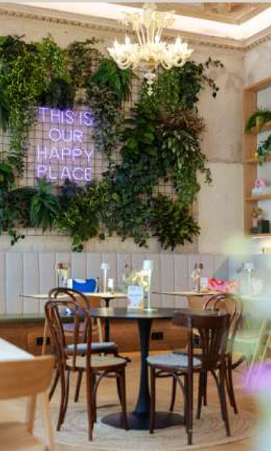
Cafe Goldstück, 1030 Wien