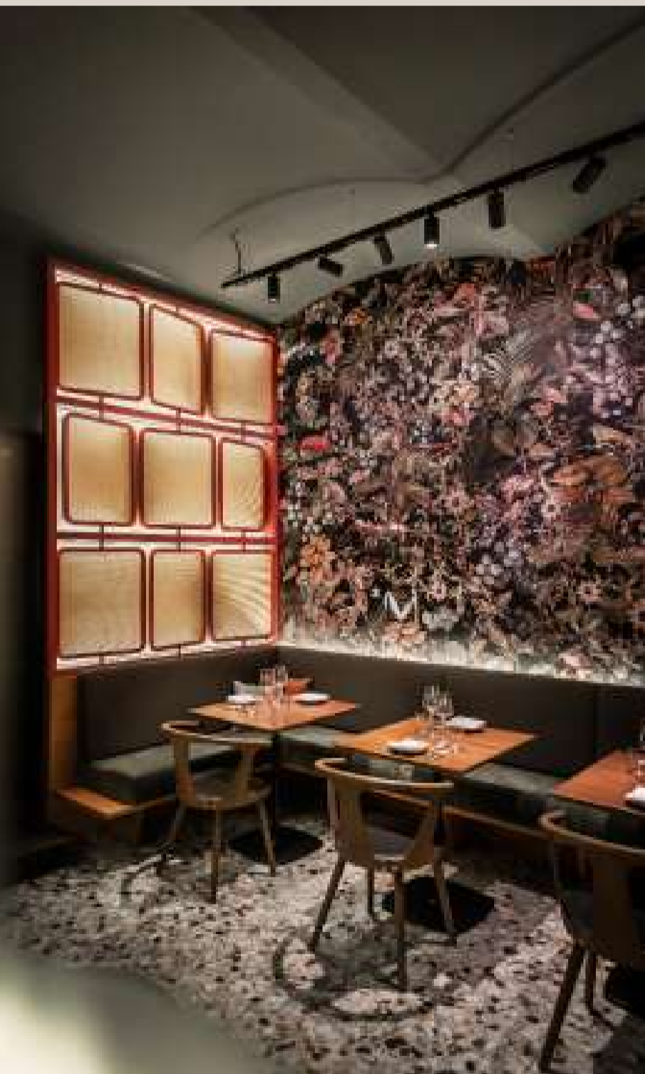
Dining Ruhm, 1040 Wien