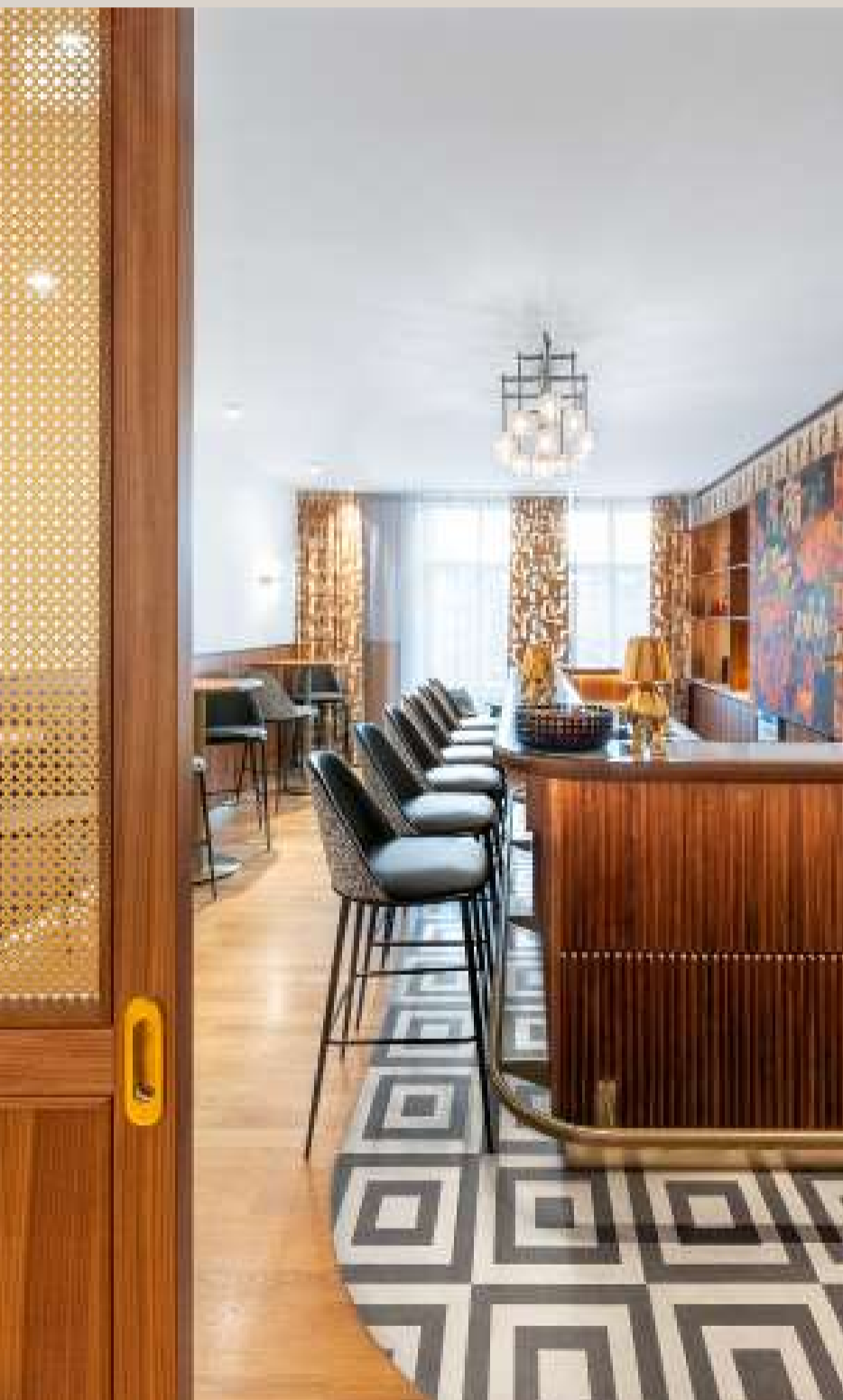
Campari Austria Office, 1010 Wien