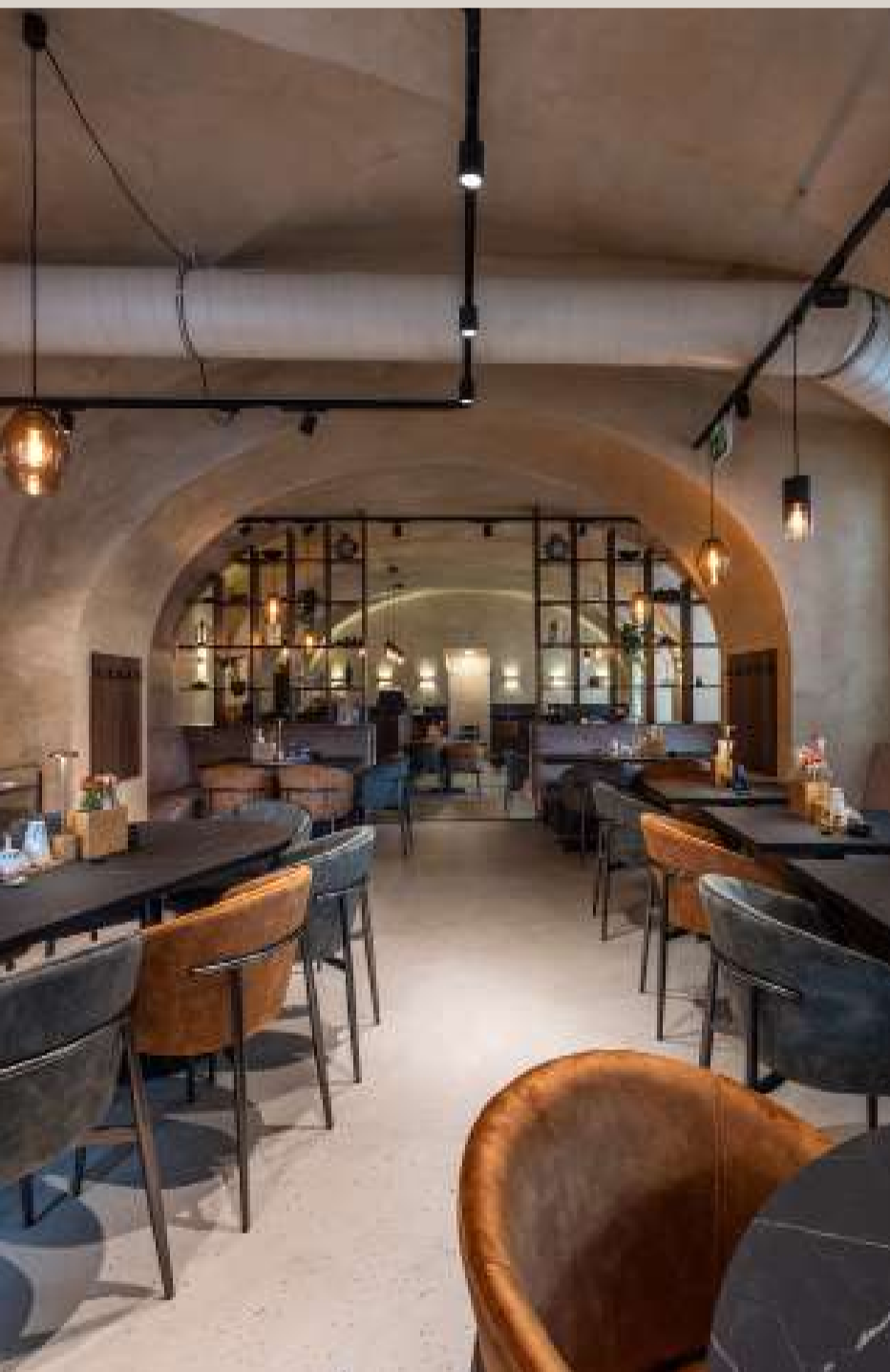
Makka, 1010 Wien

IM LETZTEN SCHRITT ENTSCHIEDET SICH WIE EIN RAUM WIRKT: